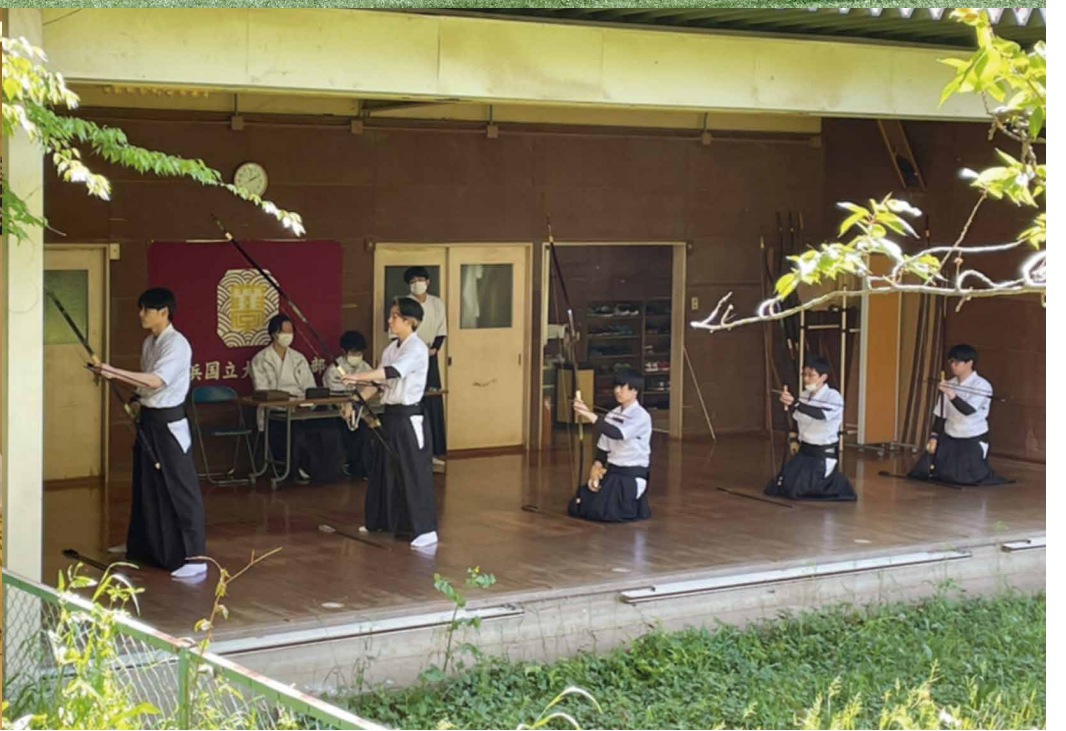
上：アメリカンフットボール部 下左：アカペラサークル Stairways 下右：弓道部