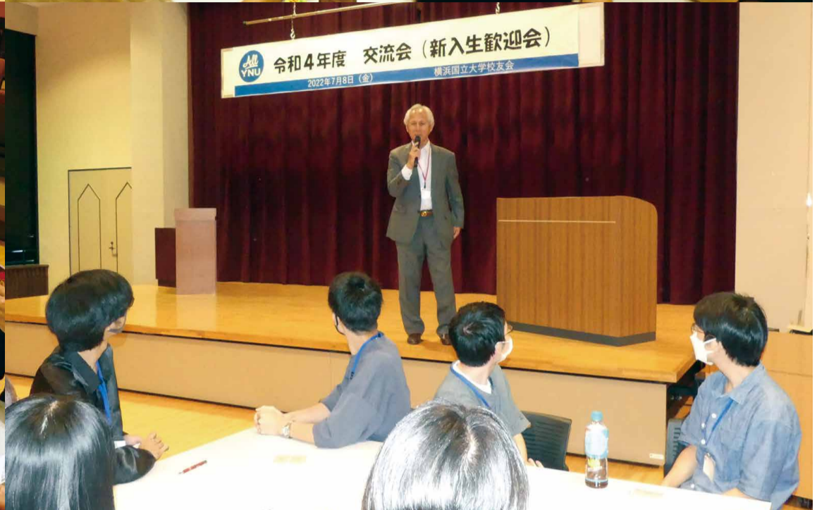
交流会 (新入生歓迎会)