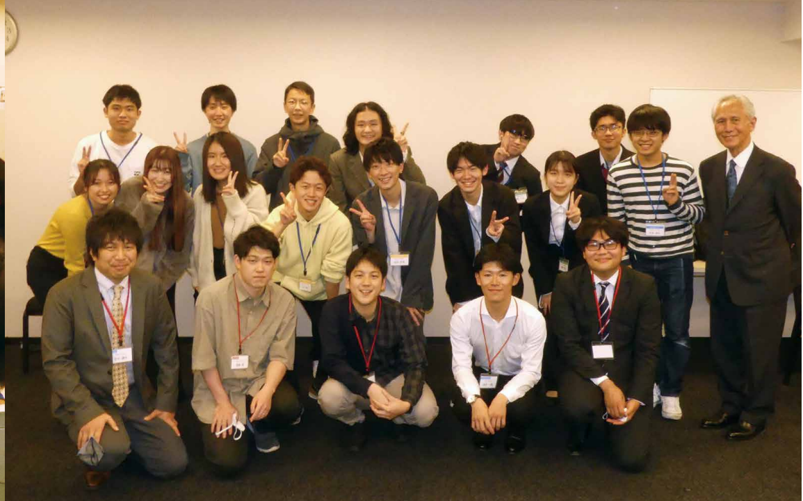
上段：横浜経営者の会による模擬面接会 下段：OB・OGと現役学生との交流会「ヨココク・ツナガル」