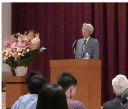
昨年度第4回小泉元内閣総理大臣の講演

教育人間科学部、経済学部、経営学部、理工学部と校友会はそれぞれの学部と共催で、秋学期に4回開催。各学部生にとってより身近な興味深いテーマで講師をお呼びします。追って校友会ホームページで案内しますが、学生はどの講演会も参加できます。校友会会員証をお持ちの学生の保護者の方も参加できます。