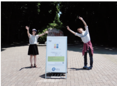
アプリコンテスト宣伝用の看板設置風景

従来からの各学部同窓会活動は専門性の高い分野における卒業生との縦の交流が中心でしたが、校友会は在学生を中心に、学部・大学院の枠を超えた横の交流や国際的な交流を重視しています。このALL YNU体制を基盤に、益々多様化する社会において在学生が光り輝ける存在として羽ばたけるように、校友会ではこれまでに教育支援などを