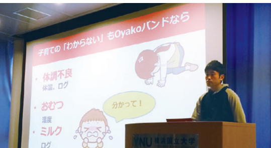
上：長谷部学長から開発部門賞の授与 下：最終審査の発表の様子（上下昨年度）