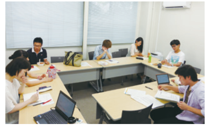
毎週開催している学生幹事会Seagulls会議の様子

活動：週一のミーティングと各企画ユニット会議を基本として、学生目線と社会人目線との調和を目指した活動と運営を行う