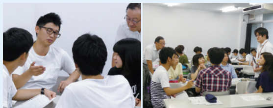
まなび座Ⅰ：講師と学生、学生同士が議論

校友会の協力により昨年開講した教養教育科目「まなび座Ⅰ」(高大接続・全学教育推進センター 市村光之准教授)は、出席率97%、授業満足度3.81(4段階)と好評でした。今年度も春学期に、12名の卒業生をゲスト講師に迎え学生たちと語り合いました。主体的に学ぶとは、スペシャリストとジェネラリストの違いなど、深い議論が交わされました。