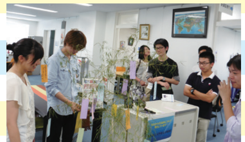
上：七夕の短冊に願いを込めて：校友会事務局前 左：全員集合：本部棟前にて