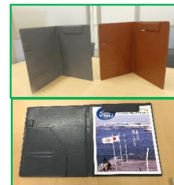
入会記念品 (黒 or 茶)